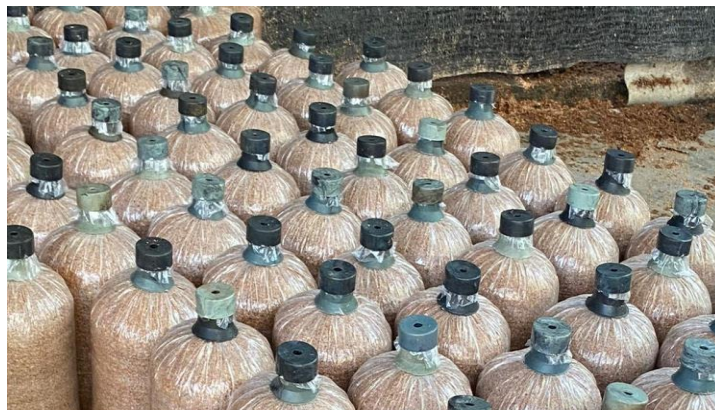
Gambar 3. Hasil Pembuatan Baglog Jamur Tiram

yang baik. Setelah dilakukan pemaparan tentang potensi dan kelebihan budidaya jamur tiram, masyarakat mengaku lebih memahami bahwa budidaya jamur tiram bukanlah suatu kegiatan yang membutuhkan biaya yang besar dan waktu yang ekstra. Sehingga masyarakat dapat menggeluti budidaya jamur disamping profesi masyarakat desa yang rata-rata mayoritas sebagai seorang petani padi.